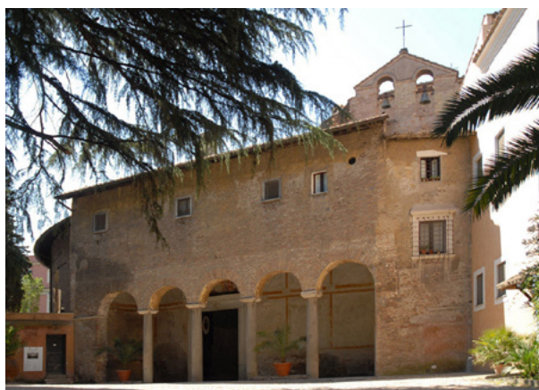
[Basilica di Santo Stefano Rotondo al Celio]