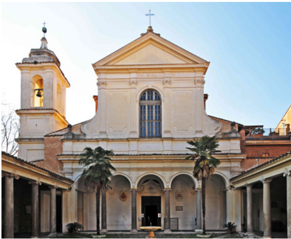
[Basilica di San Clemente - Narthec]