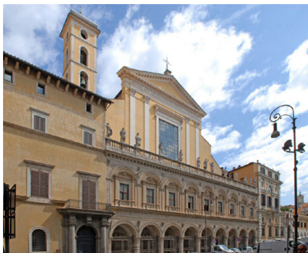
[Basilica dei Santi XII Apostoli - Cripta ]